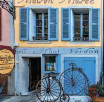
Ouverture des sites