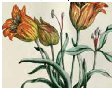
Découverte du patrimoine